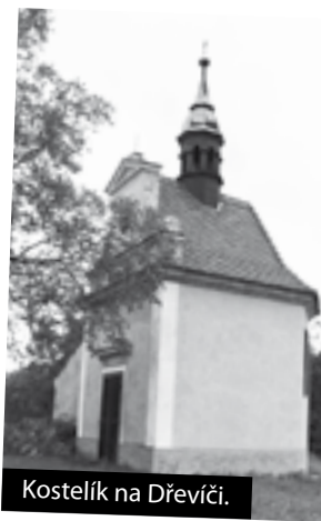
Kostelík na Dřevíči.

Bližší informace o Kalivodském hůlkování 2011 získáte na internetových stránkách www.kalivody.cz .