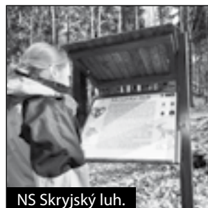
NS Skryjský luh.

Začátek stezky je na skryjské straně mostu přes řeku Berouнку. První část stezky (1. a 2. panel) vede podél řeky Berouanky, druhá část Skryjským luhem proti proudu Skryjského potoka.