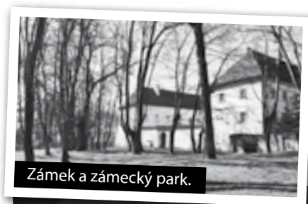
Zámek a zámecký park.

A hlavně – podíváte se do sklepů zámku. Kdo už měl možnost tam nahlédnout, mluví o nich s nadšením. V části sklepů vznikl