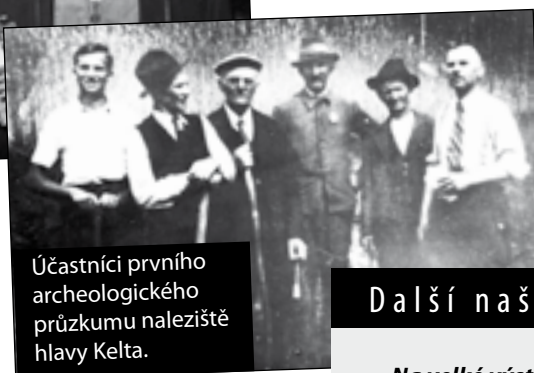
Účastníci prvního archeologického průzkumu naleziště hlavy Kelta.