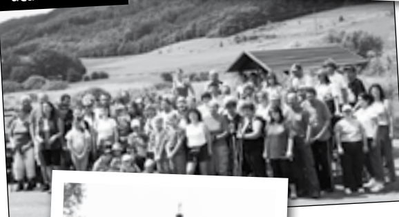
Společné foto účastníků akce.