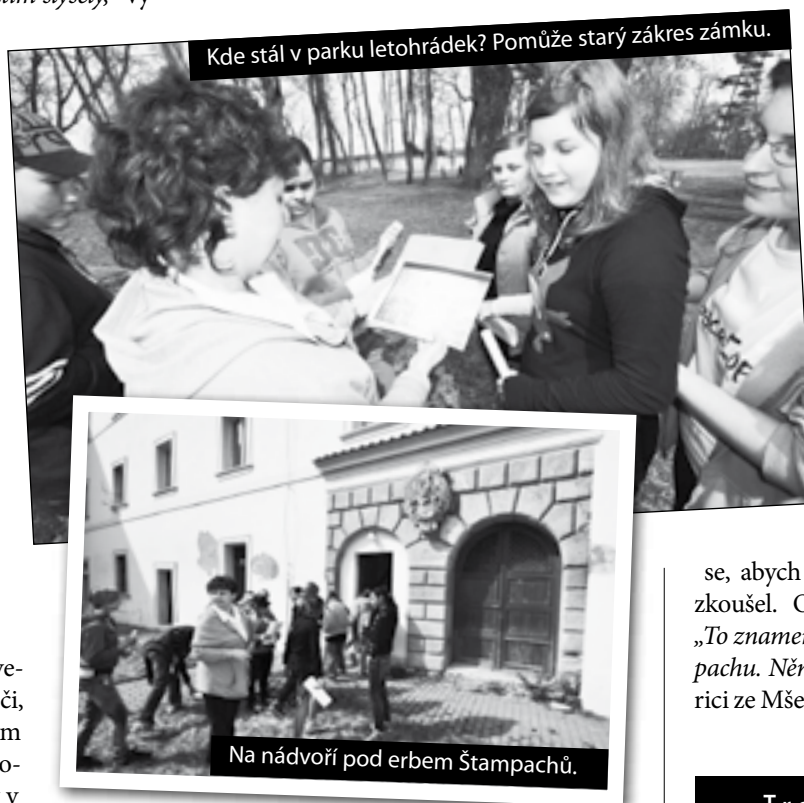
Kde stál v parku letohrádek? Pomůže starý zákres zámku.