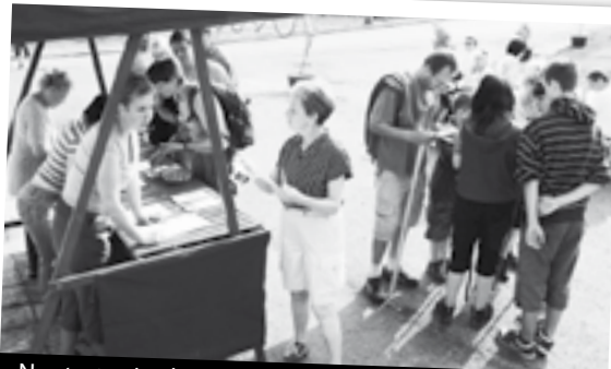
Na startu si vyberete z několika připravených tras.

„Trasy vám dají zabrat, ale přírodní scénérie, kterou pochod vede, stojí rozhodně zato,“