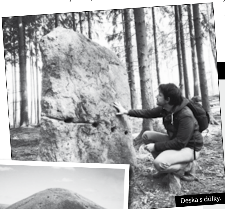
Deska s důlky.

Špičák je zvláštní vrch. Jeho nápadná pravidelnost a spíše skromné proporce dokonce vedly k fantastické myšlence, jestli je to vůbec dílo přírody. Špičák jako by prý z oka vypadl slavnému umělému kopci Silbury Hill v Anglii, navršenému z neznámého důvodu tři tisíce let před naším letopočtem.